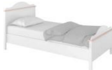
LN-08 łóżko z materacem bonellowym 104 x 100 x 209 cm