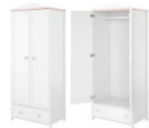
LN-01 szafa z drążkiem 85 x 196 x 52 cm

Wybierz jedną z dwóch szaf - z długim drążkiem na wieszaki lub szafę z dwoma krótszymi drążkami i półkami.