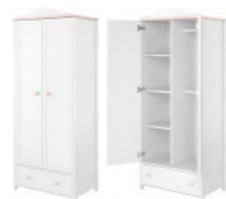
LN-12 szafa z drążkami i półkami 85 x 196 x 52 cm