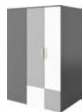
PO-00P (wersja prawa) garderoba 130 x 193 x 93 cm