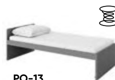
PO-13 łóżko z materacem bonellowym 206 x 67 x 95 cm