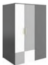
PO-00L (wersja lewa) garderoba 130 x 193 x 93 cm