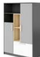
PO-05 szafka średnia 100 x 163 x 40 cm