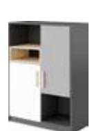
PO-06 szafka niska 100 x 130 x 40 cm