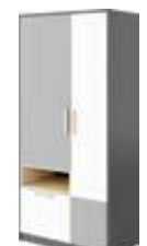
PO-02 szafa dwudrzwiowa 90 x 193 x 50 cm