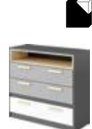
PO-08 komoda 100 x 90 x 40 cm